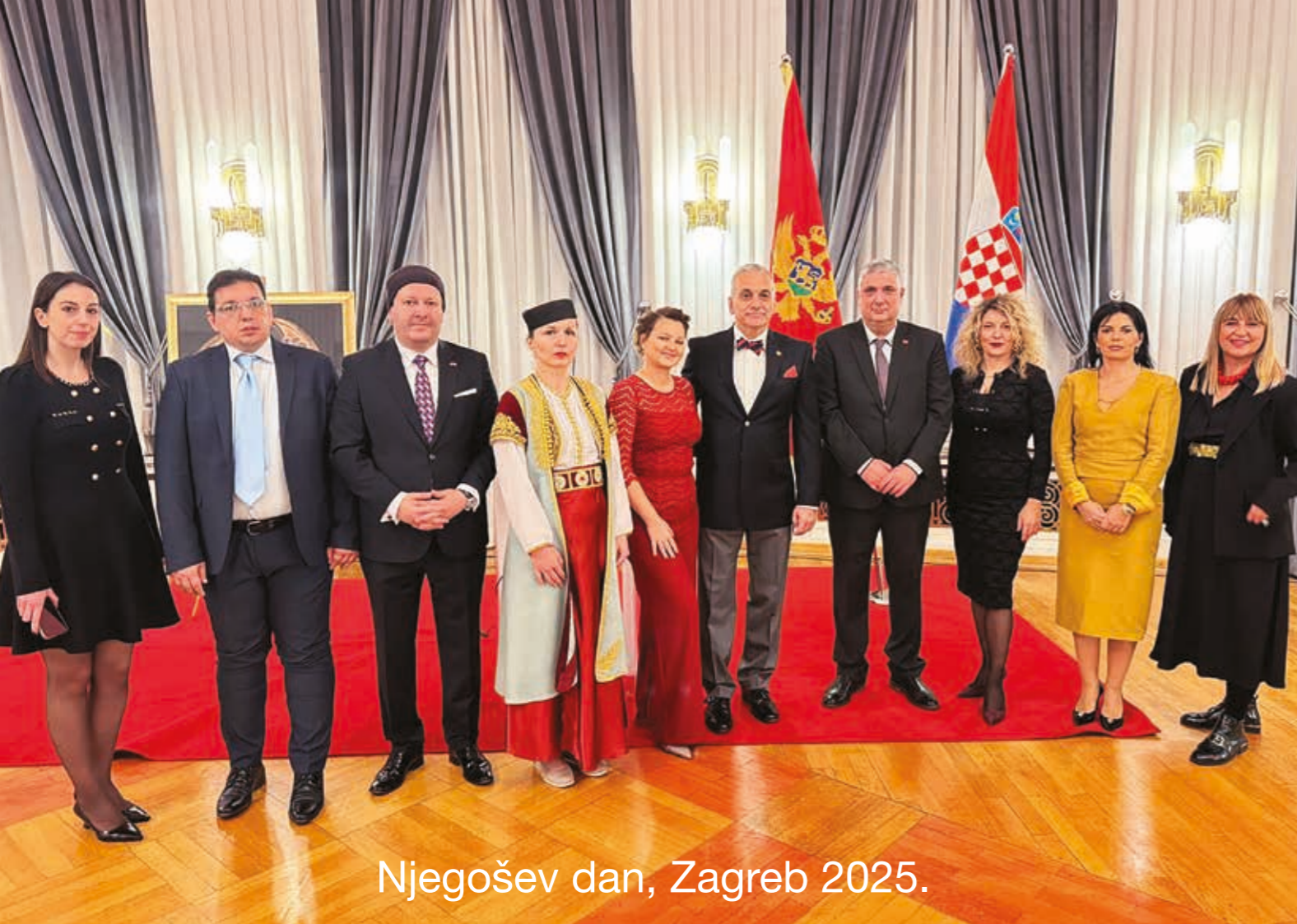
Njegošev dan, Zagreb 2025.