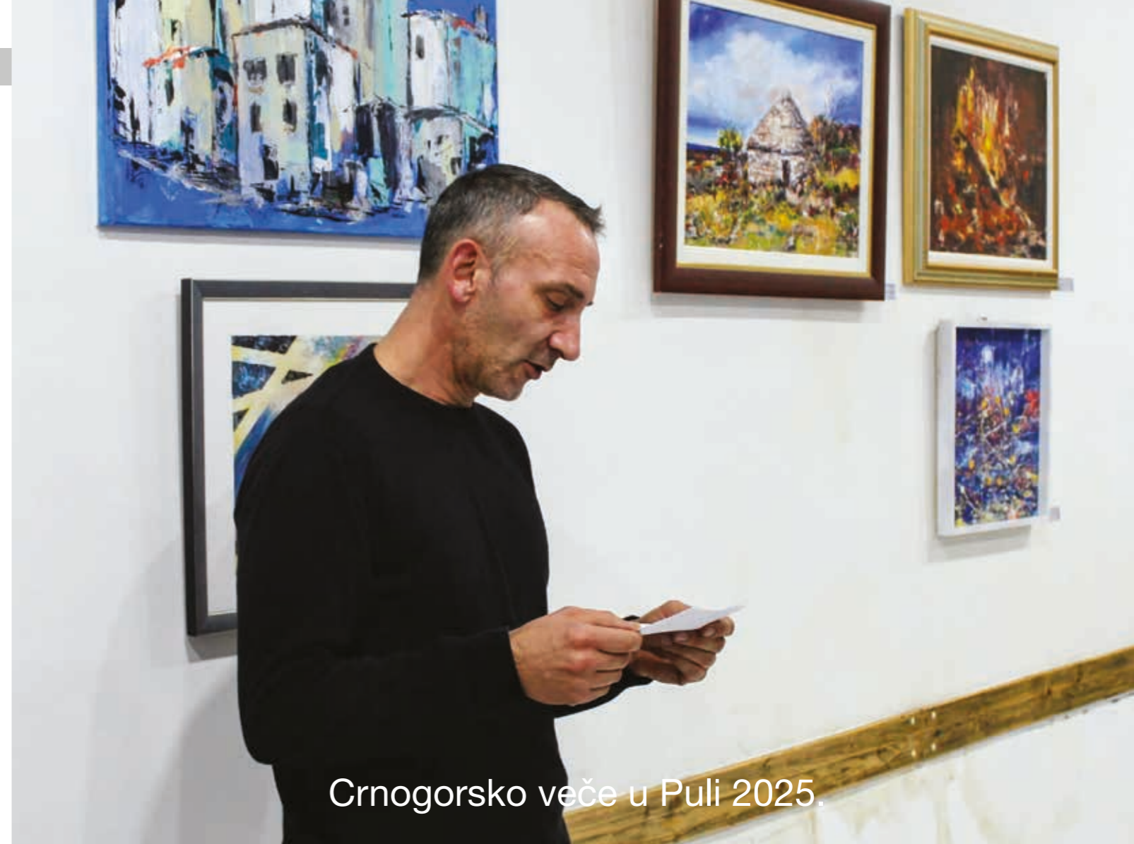
Crnogorsko veče u Puli 2025.