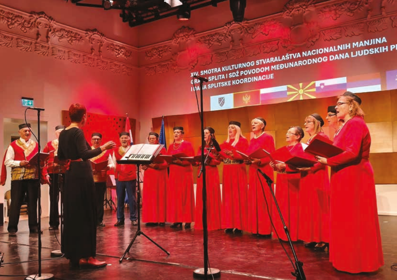
Crnogorsko veče u Splitu 2025.