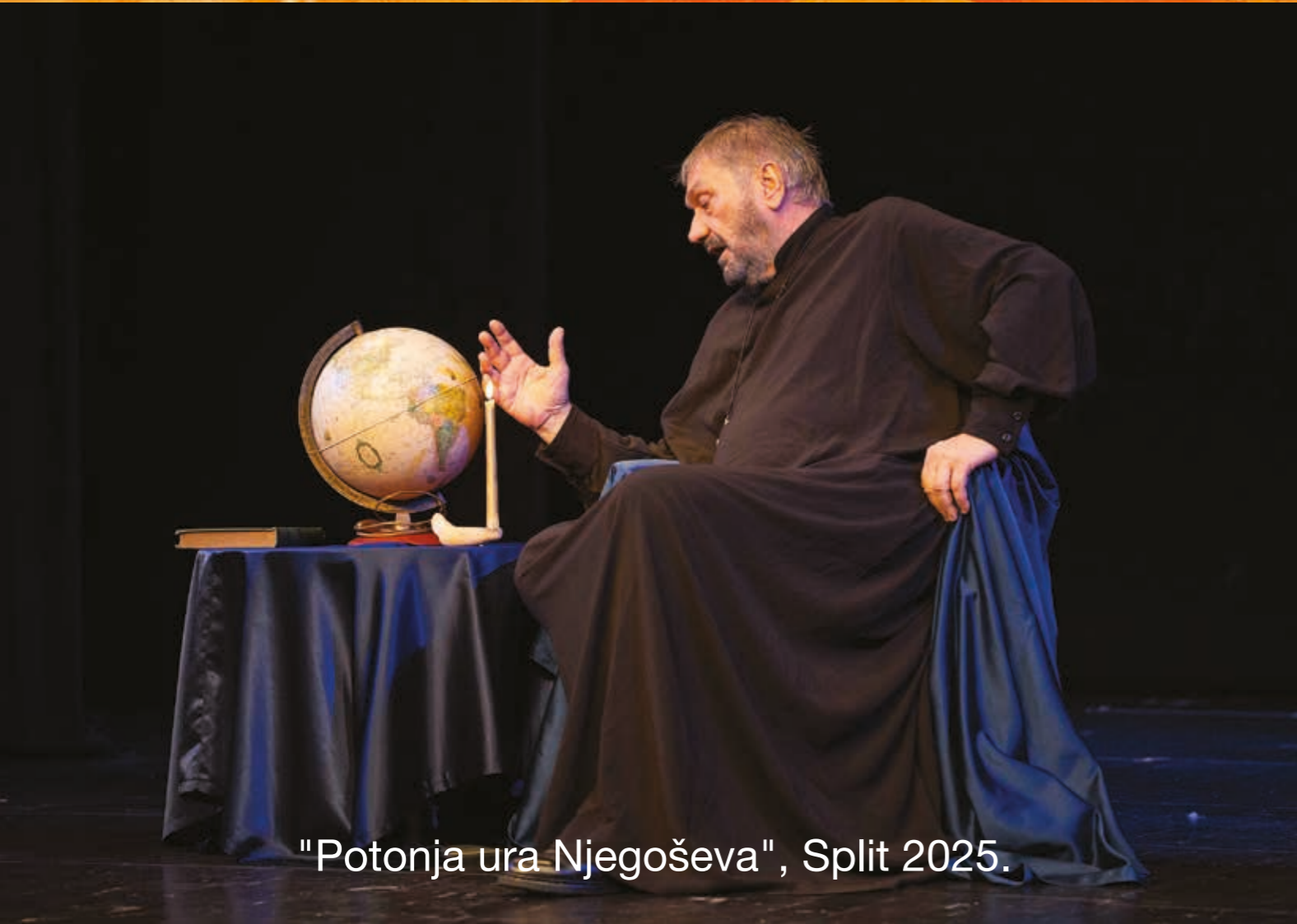
"Potonja ura Njegoševa", Split 2025.