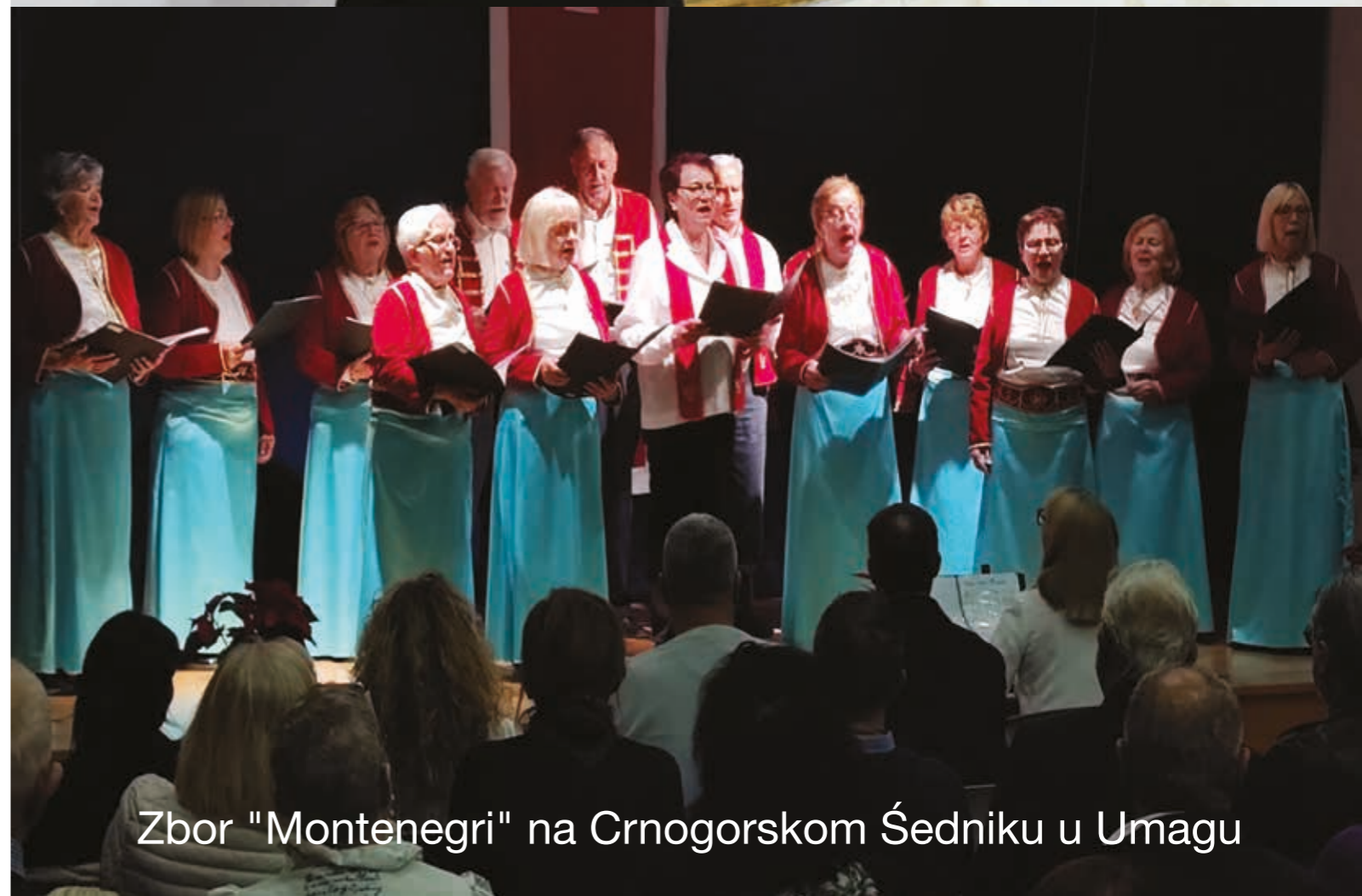
Zbor "Montenegri" na Crnogorskom Šedniku u Umagu